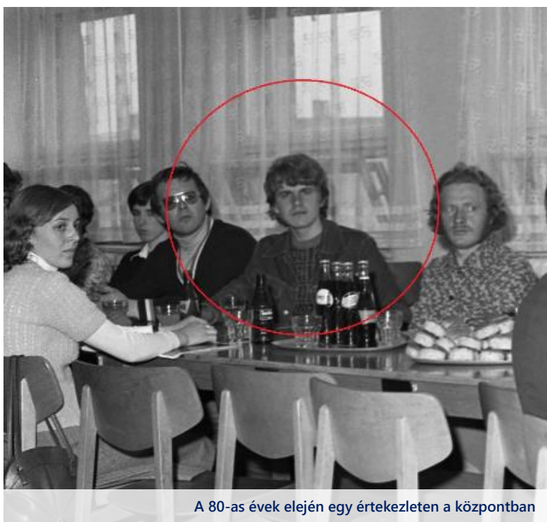
A 80-as évek elején egy értekezleten a központban