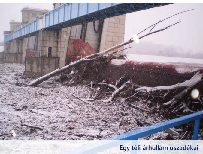
Egy téli árhullám uszadékai

Erős izgalmakat a műtárgyon, gáttáblákon fennakadó, nagyméretű uszadékfák szoktak okozni. Ilyenkor munkatársainknak nagy bátorságról tanúbizonyságot téve kell lemászniuk kb. 15 méter mélyre, és fűrésszel, baltával kell ezeket eltávolítaniuk. Természetesen rendelkezésükre áll megfelelő védőfelszerelés, de a hatalmas erővel, és robajjal lezúduló vízhez lemászni, ott munkát végezni, akkor sem hétköznapi tevékenység. A pilléreken fennakadó fákból álló torlaszokat a Hajózás jégtörő hajói rombolják le. Ezekre a működőképesség fenntartása érdekében van szükség, máskülönben a beakadó fák mozgásképtelenné tennék a gáttáblákat. Szintén jelentős figyelem kíséri a jeges árvizeket. Fontos a szervezés, a megfelelő előrejelzés, és ezek alapján a megfelelő üzemállapot beállítása az érkező jég fogadására, amelynek tömege elérheti a több millió tonnát is.