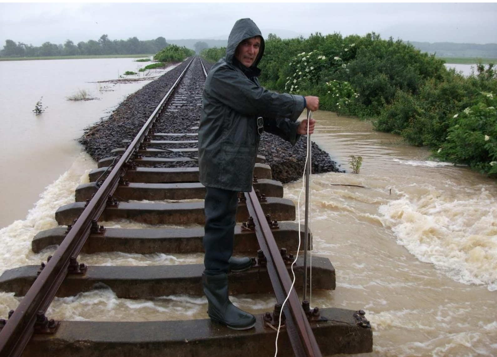
Extrém körülmények között végzett mérés 2010. júniusban a Hernádon