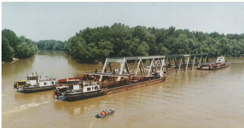
Úton a polgári híd acélszerkezete... A tokaji közúti hídról készített fotón éppen a Bodrog torkolata előtt látható, az alacsony hídnnyílás miatt vízbe süllyesztett szállítmány