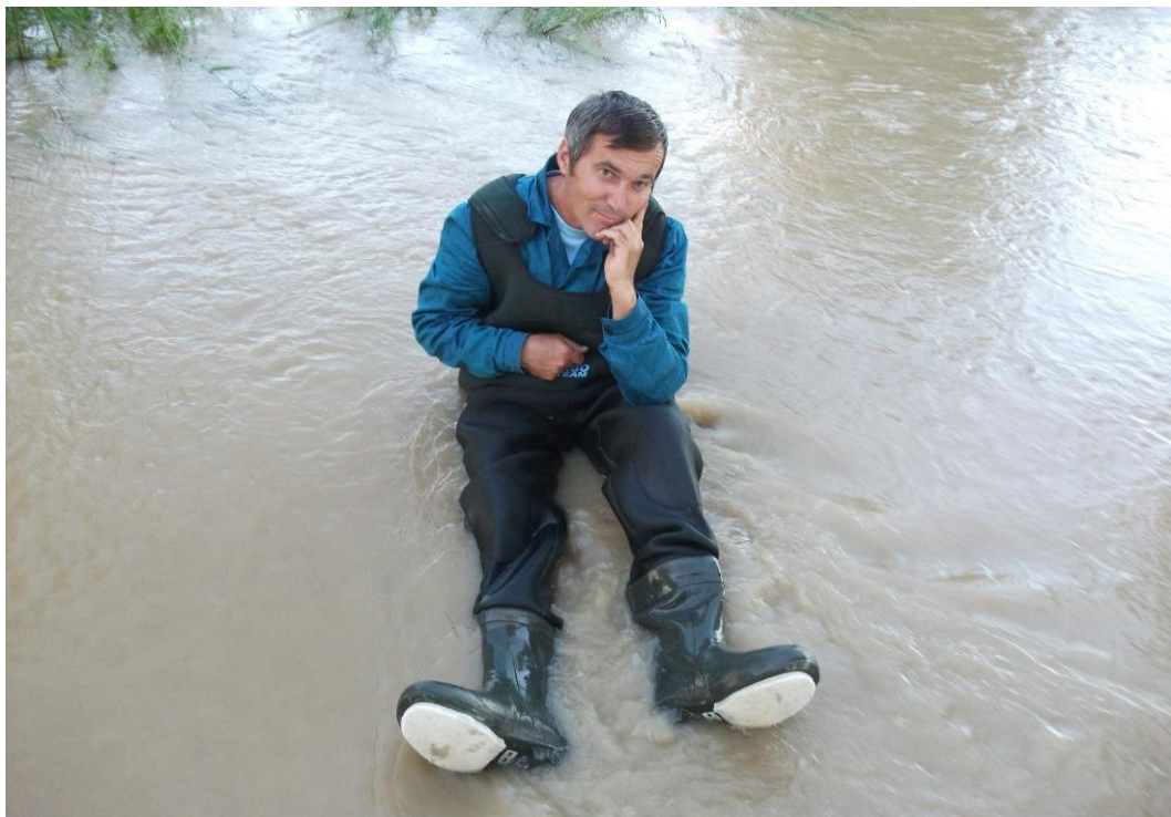
A helyzet komolyságát néha oldani kell egy kis humorral

A munkaköre akár egyszerűnek tűnhet: vízhozamot mér. Hogy ez mégsem annyira egyszerű, azt az élet már bebizonyította. A működési területünk összetett, a forrásoktól, az egyéb vízfolyásokon át, a folyókig bezárólag minden előfordul és ezeket mind mérni is kell. Természetesen a vízfolyások nagyságától függően más és más az alkalmazott mérési módszer, a méréshez használt eszközök. A méréstechnika hatalmas fejlődésen ment keresztül az