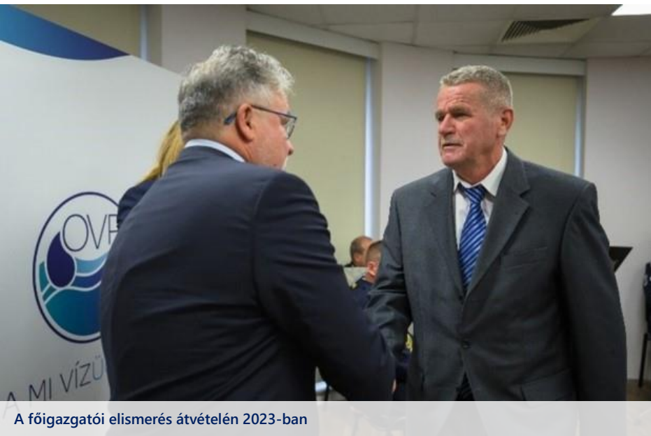
A főigazgatói elismerés átvételén 2023-ban

2015-ben döntött úgy, hogy a kivitelezésből visszatér az Igazgatósághoz, azóta területi felügyelőként dolgozik Igazgatóságunk Sárospataki Szakasz mérnökségén. Munkáját mindig magas színvonalon látta és látja el, szakmai tudása és tapasztalata a fiatalabb kollégáknak is nagy segítségére van betanulásuk, mindennapi munkavégzésük során, példaként áll előttük. Hobbija a sport, leginkább a labdarúgás áll közel hozzá, gyermekkorától folyamatosan aktív résztvevője a