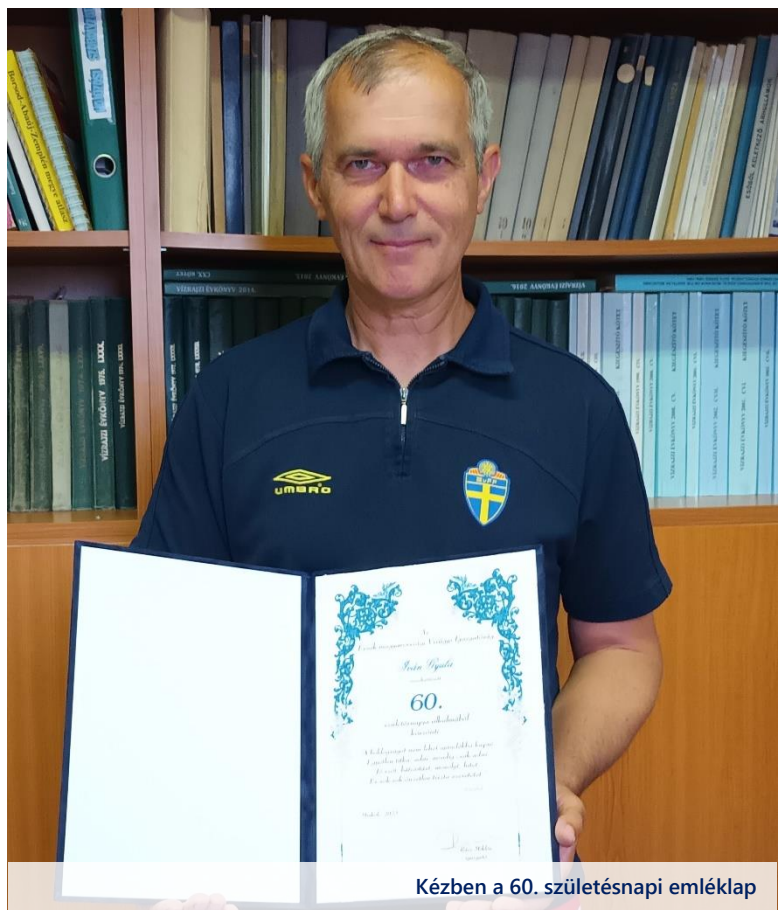
Kézben a 60. születésnap emléklap

Bár a feladatköre az eltelt évtizedekben közel azonos volt, a ledolgozott évek alatt mégis több osztályon dolgozott. A Vízgazdálkodási Osztályra került felvételre, majd hosszabb ideig volt a Vízgyűjtőgazdálkodási Osztály, később a Vízgazdálkodási és Vízrajzi Monitoring Osztály tagja. 2014. évtől pedig a Vízrajzi és Adattári Osztály dolgozói közé tartozik. Ha minden jól alakul, akkor talán erről az osztályról fog néhány év múlva nyugdíjba menni.