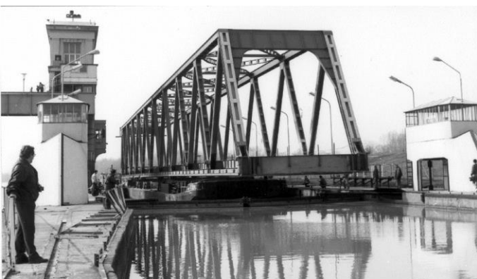
A Polgári Tisza Híd elemének zsilipelése 1994-ben

A vízszint szabályozását a vízerőmű üzemeltetésével és a 3 db, egyenként 37 m széles, és 8 m magas acélszerkezetű gáttáblával lehet biztosítani. A vízkormányozást 360 m 3 /sec vízhozamig a műtárgy részét képező erőmű áramtermelő vízturbinái is el tudják végezni, ettől nagyobb vízhozam esetén a duzzasztómű gépkezelői (kollégáink) a gáttáblák vízhozam függő billentésével, vagy kiemelésével oldják meg az üzemi vízszint megtartását. Nagy árvíz esetén a gáttáblák teljesen kiemelhetők, így szabad, akadálymentes lefolyás biztosítható.